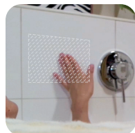
Wischen und/oder Tasten Wiping and/or touching